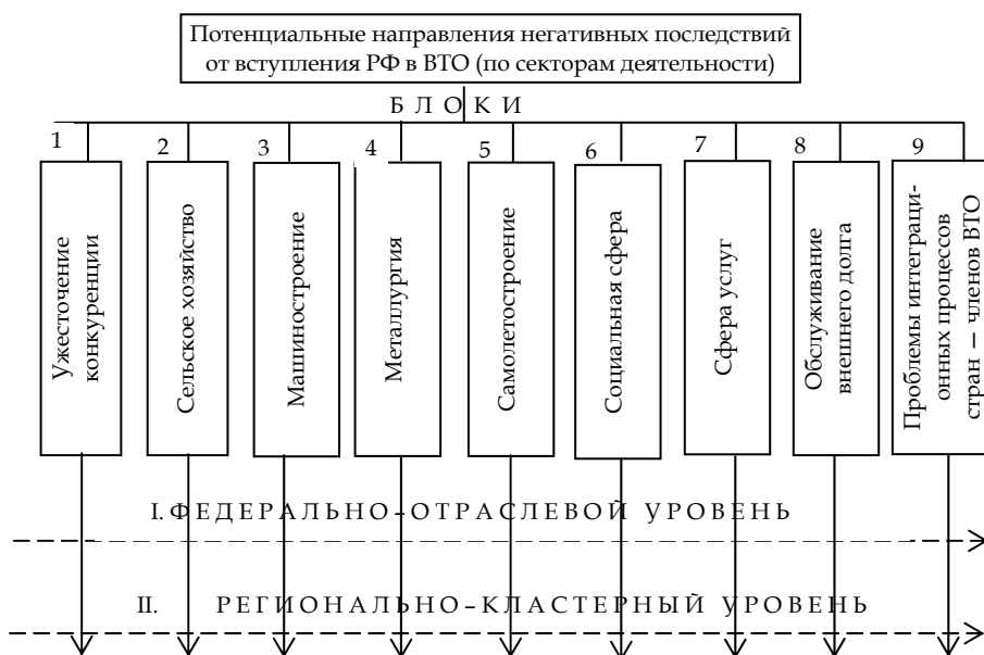
Рис. 1. Структуризация наиболее уязвимых сфер экономической деятельности, требующих защиты от иностранной конкуренции при участии России в ВТО

Опираясь на результаты анализа проблемы возможных негативных последствий, проделанного государственными органами и различными экспертами, ее структуру обобщенно можно представить в виде схемы (рис. 1). Она выявила девять блоков наиболее уязвимых сфер экономической деятельности, требующих защиты от иностранной конкуренции при участии России в ВТО.